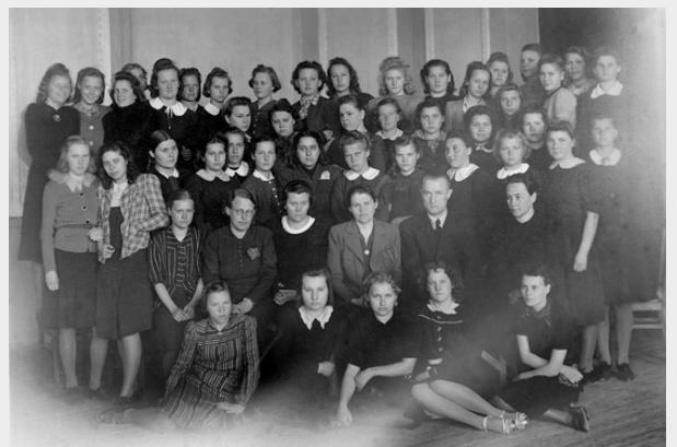
Grupp Tartu III Gümnaasiumi õpilasi 1942. aastal