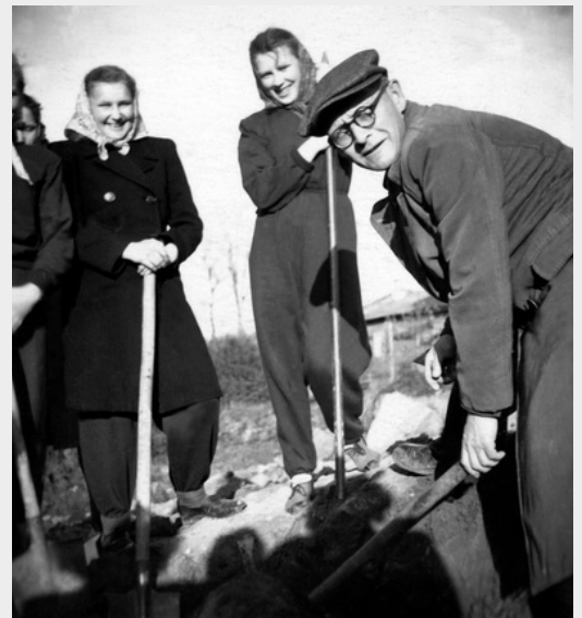
Koolipere Tartu linna taastamistööl Lille mäel